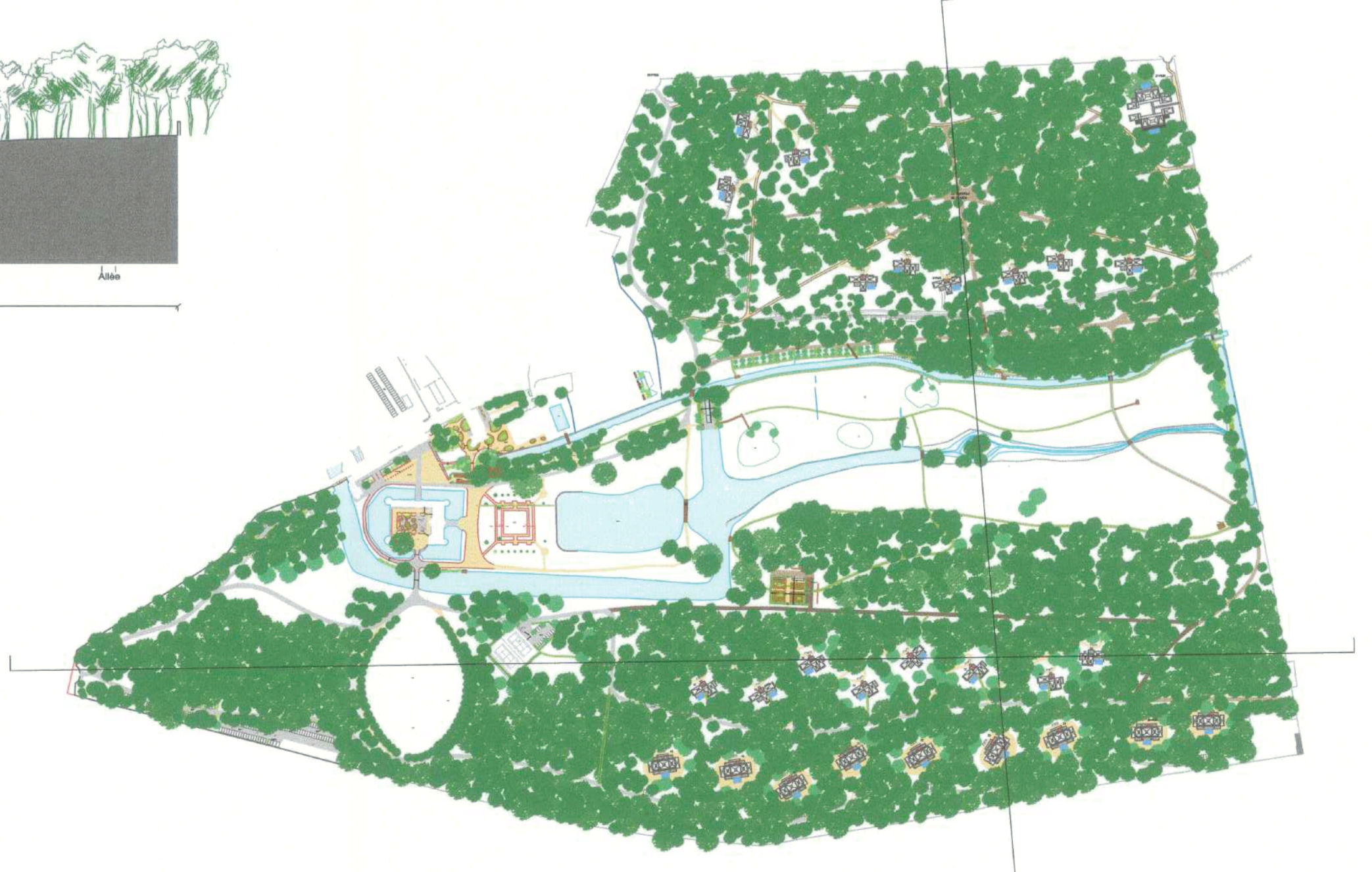
Plan de repérage des coupes Echelle 1/5000