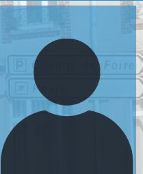
Steeve LOCHET Conseiller municipal