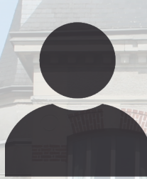
Jean-Louis DEHAECK Conseiller municipal