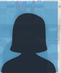
Céline CLARISSE Conseillère municipale