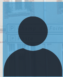
Steeve LOCHET Conseiller municipal