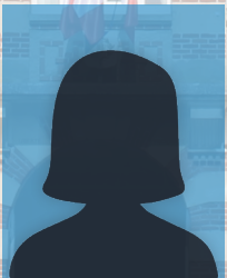
Céline CLARISSE Conseillère municipale