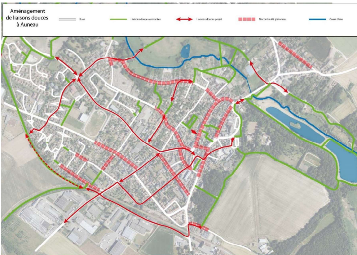
F4 – Développer les mobilités douces – bourg d'Auneau et ensemble du territoire