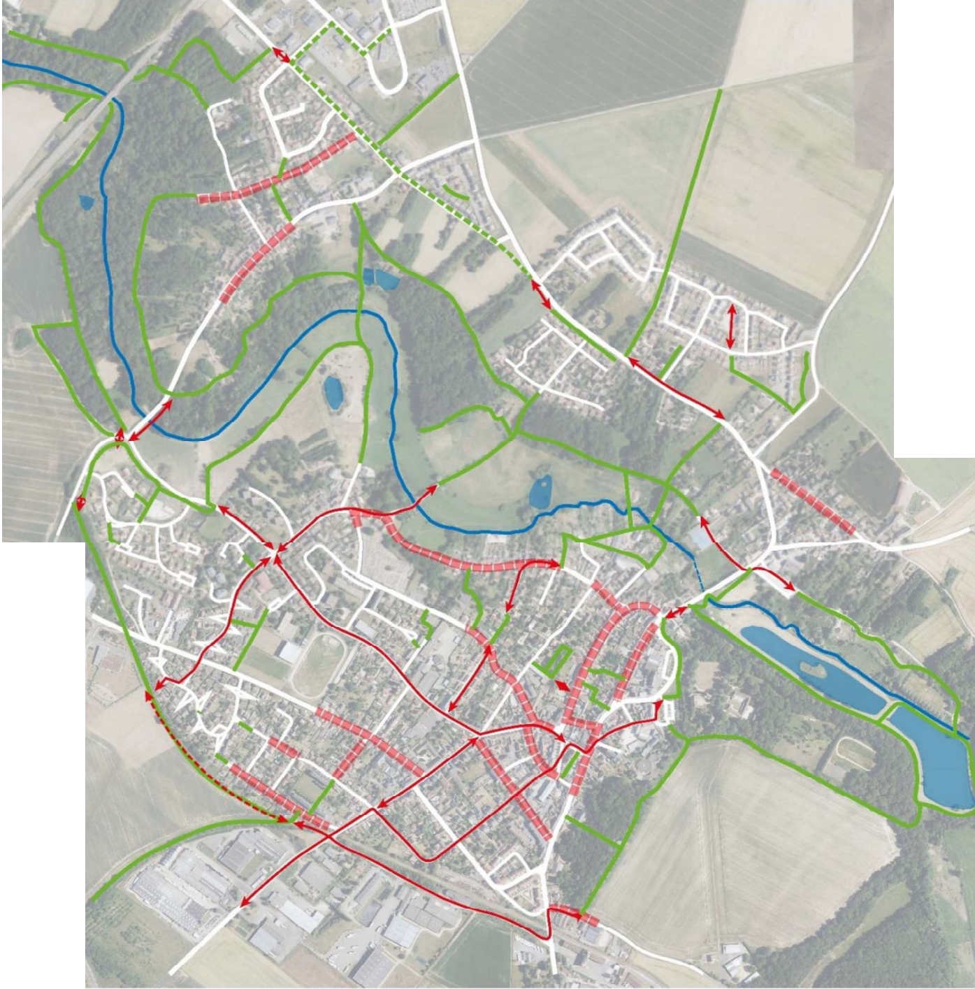
F4-2 – Développer les mobilités douces Développer une liaison douce entre le bourg d'Auneau et la vallée