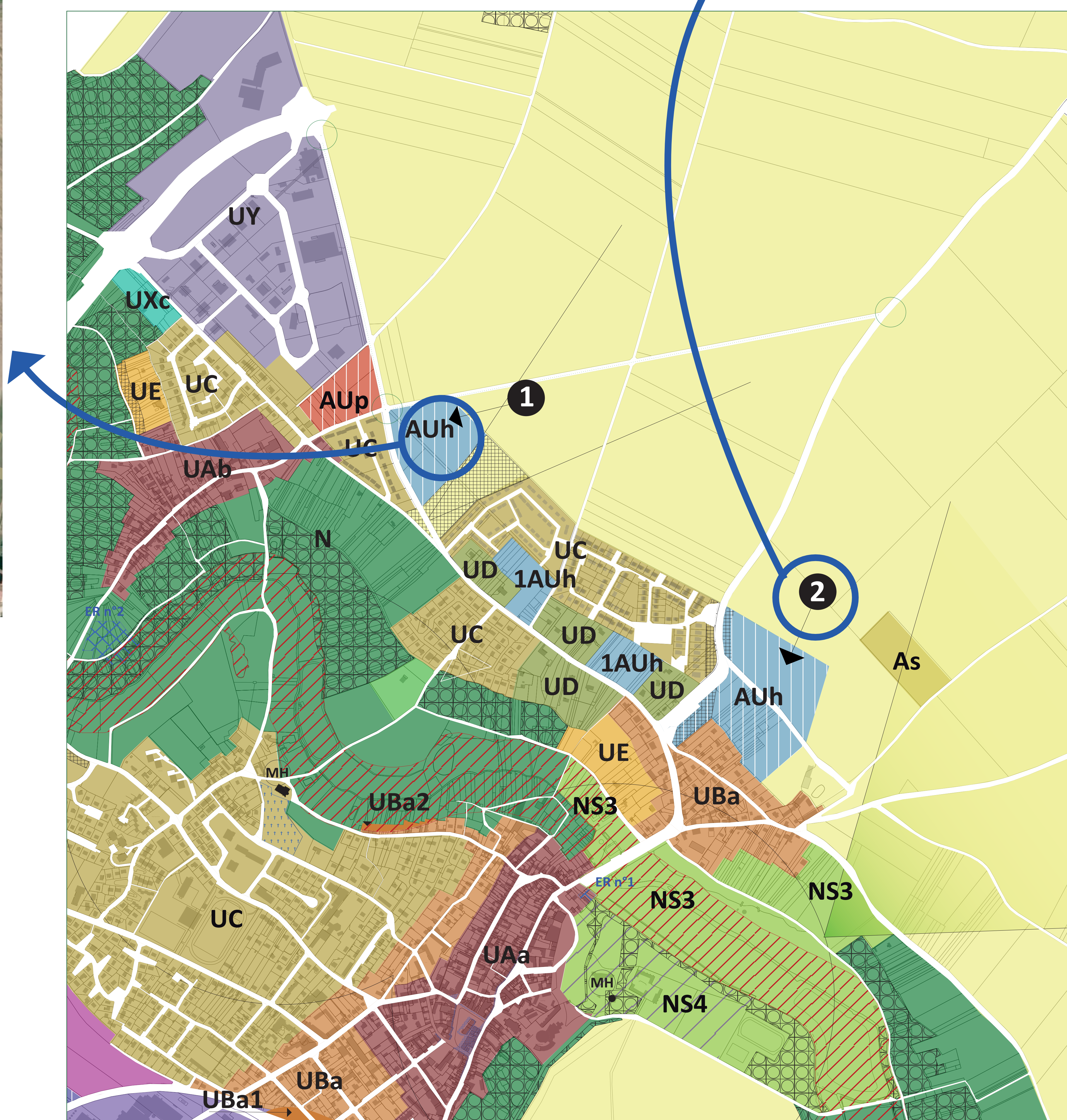
Principes d'organisation du site

Les orientations sont destinées à guider les aménageurs lors de l'élaboration des projets de développement sur les sites identifiés